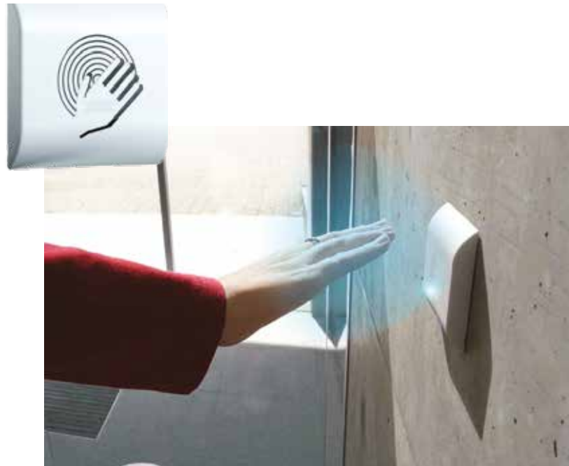
ASSA ABLOY Magic Switch

Wir bieten die umfassendsten und flexibelsten Serviceleistungen der Branche, einschließlich regelmäßiger Sicherheits- und Qualitätsprüfungen. Schnelle Reaktionszeiten und zertifizierte Servicetechniker stellen sicher, dass Ihre Tür- und Toranlagen stets voll funktionsfähig sind und Ausfallzeiten vermieden werden; Marken- und herstellerunabhängig.