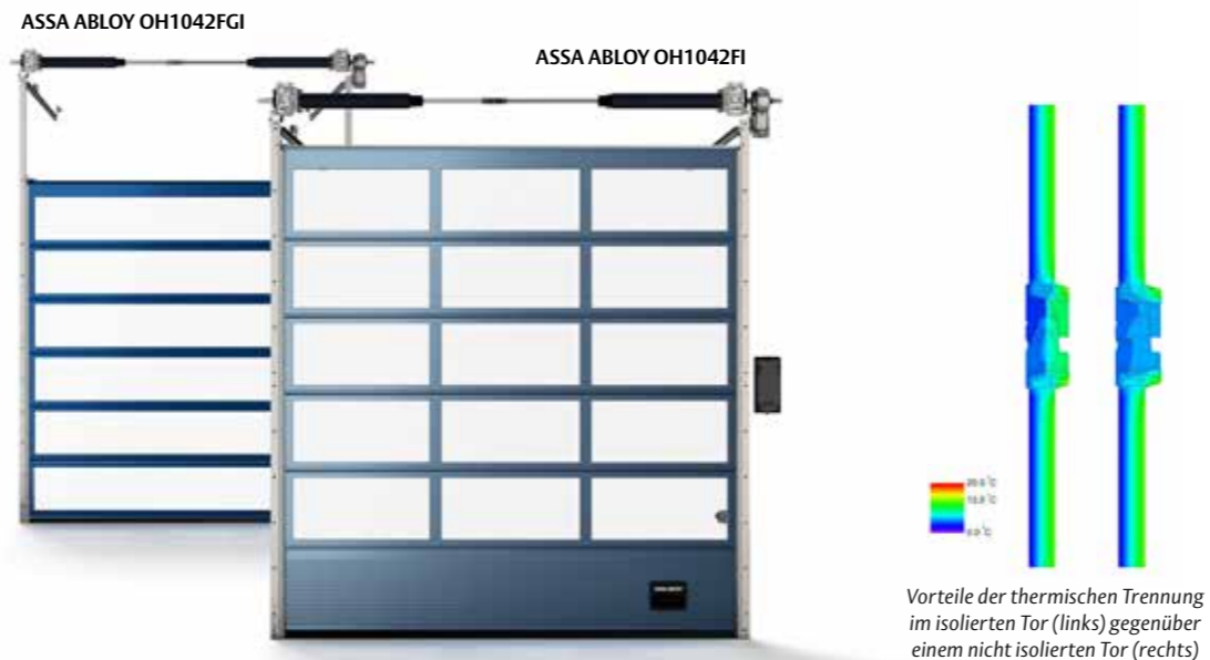
Vorteile der thermischen Trennung im isolierten Tor (links) gegenüber einem nicht isolierten Tor (rechts)

Unsere vollverglasten Tore jetzt mit thermisch getrennten Aluminiumprofilen in bewährter Sektionaltor-Qualität von ASSA ABLOY.